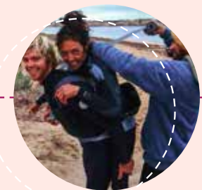
DUCT TAPE SURFING (5') (Mark Triple) 2013

Mejor Guión y Premio WOP del Mendi Film Festival 2014 Tras la muerte de un amigo, el artista y escalador Jeremy Collins se embarca, durante cuatro años, en un viaje que le llevará en cuatro direcciones, hasta los confines de la tierra, para esparcir sus cenizas. En el camino, llenará su cuaderno de dibujo y tratará de responder preguntas universales en torno a los vínculos que nos unen.