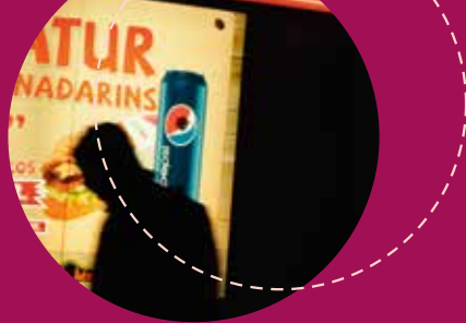
LUZ A LA DERIVA (18') (Iñigo Salaberria) 2015

Islandian jendea iluntasunean bizi da urteko zati handi batean. Gauaren alde ona da atze-oihal baten modukoa dela, dekoratua ezabatzen du eta oinarriko gauzen aurrean uzten zaitu, marraztu behar dugun paper baten aurrean egongo bagina bezala.