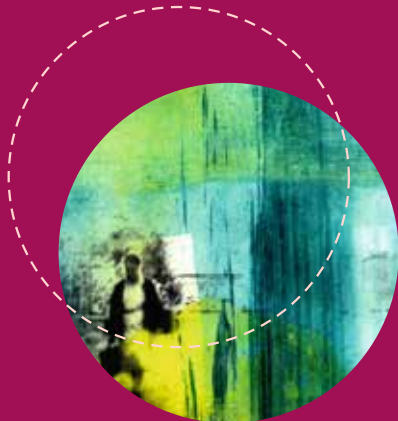
KAMAKSHI (24') (Satinder Singh Bedi) 2015

Durante la ocupación nazi, un hombre visita la ciudad francesa de Salers, donde una mujer loca lo sigue. Muchos años después, aquel viajero vuelve a la misma ciudad.