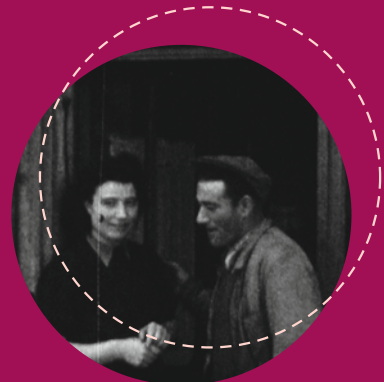
RENÂITRE (23') (Jean-François Ravagnan) 2015

Sarahk telefono-dei bat jasotzean iraganeko eztanda bat eragiten dio barruan. Bakarrrik dago, gertuen dauzkan pertsoneri eta maiteen dituen pertsoneri gezurra esaten die eta buruan ideia bat besterik ez dauka: Mediterraneo gurutzatzea eta Tunisiara itzultzea. Emozio handiek eramanda, bidaiari ekin dio maite zuen gizonari behin agindu ziona betetzeko.